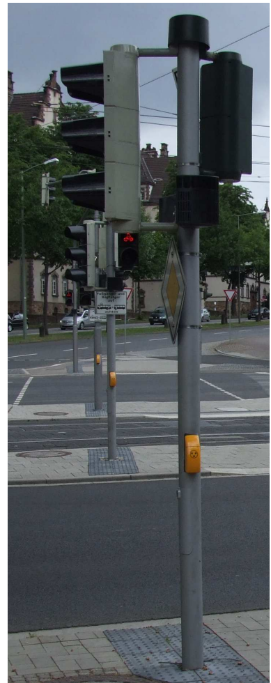
Lichtsignalanlage mit akustischem und taktilem Zusatzsignal (Lautsprecher oben, Vibrator an der Unterseite des Tasters)

Der Arbeitskreis Öffentlicher Verkehrs- und Freiraum des Normausschusses Bauwesen sowie die FGSV hatten dieser Regelung der DIN 32981 ausdrücklich widersprochen, nach der DIN 18040-3 und der RiLSA können je nach Situation taktile und/oder akustische Signale gegeben werden. Die RiLSA in der Fassung von 2015 wurde vom Bundesministerium für Verkehr und digitale Infrastruktur im September 2015 für das Straßennetz des Bundes als verbindlich eingeführt.