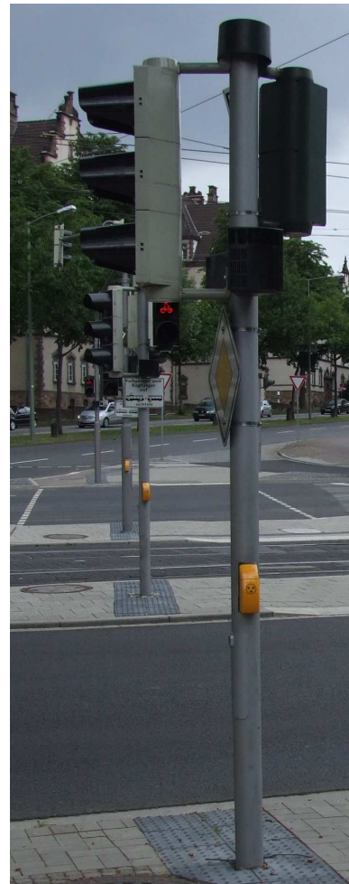
Lichtsignalanlage mit akustischem und taktilem Zusatzsignal (Lautsprecher oben, Vibrator an der Unterseite des Tasters)

Der Arbeitskreis Öffentlicher Verkehrs- und Freiraum des Normausschusses Bauwesen sowie die FGSV hatten dieser Regelung der DIN 32981 ausdrücklich widersprochen, nach der DIN 18040-3 und der RILSA können je nach Situation taktile und/oder akustische Signale gegeben werden. Die RILSA in der Fassung von 2015 wurde vom Bundesministerium für Verkehr und digitale Infrastruktur im September 2015 für das Straßennetz des Bundes als verbindlich eingeführt.